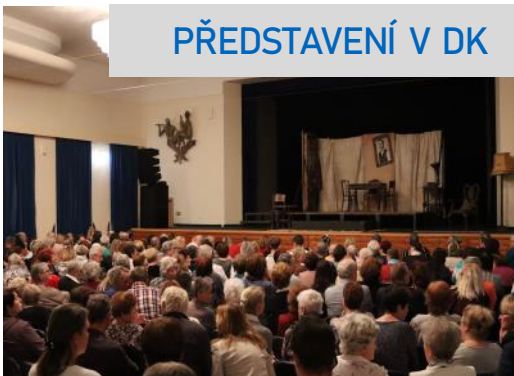
PŘEDSTAVENÍ V DK