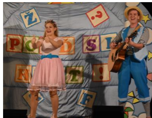
OBRAZEM Z PODZIMNÍCH AKCÍ