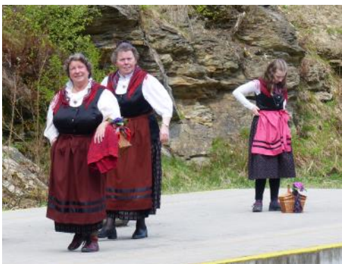
Premiérový vlak přivezl asi padesátku

cestujících, kteří navštívili Muzeum Kraslické dráhy. Po malém občerstvení, zajištěném spolkem Tradiční venkov z Josefova, se část účastníků akce vrátila zpět do Německa, část se pak vydala poznávat město Kraslice, včetně místních restauračních zařízení. Ke zpáteční cestě do Saska pak mohli tyto cestující využít druhý pár spojů, který na zdejší nádraží dorazil o tři hodiny později.