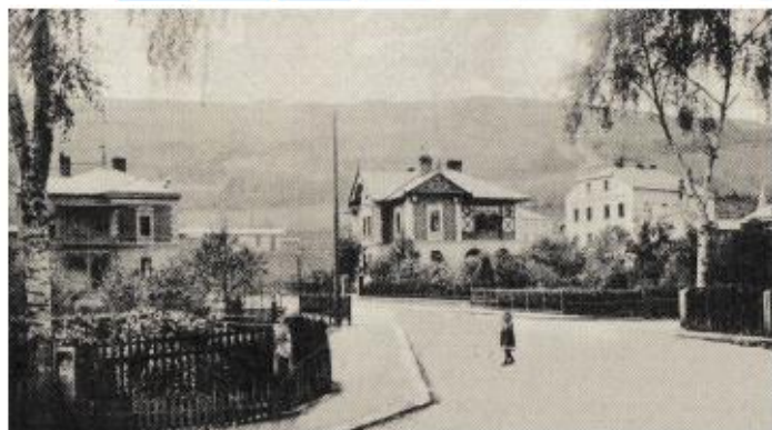
Fotografie ulice (č. 2) ↑