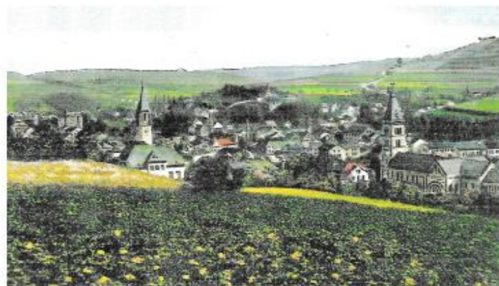
Panoramatický pohled (č. 9) ↑