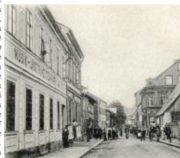
Fotografie ulice (č. 1) ↓