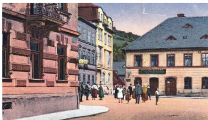
Město s obyvateli (č. 5) ↑