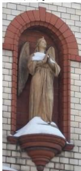
Detail (č. 6) ↓