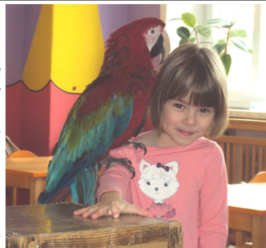
Děti a kolektiv MŠ B. Němcové

Naši školku navštívil neobyčejný kouzelník. Neměl sice kouzelnický plášť, klobouk ani kouzelnou hůlku, zato nám přivezl překvapení – živé ptáčky. A tak jsme se seznámili s čížkem, se sovou pálenou, orlem a nakonec jsme se každý vyfotili s pestrobarevným papouškem. Na závěr nám přeci jenom kouzelník předvedl několik kouzel. Vystoupení se nám moc líbilo.